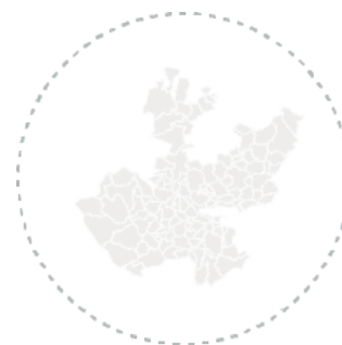
Por área metropolitana de Jalisco