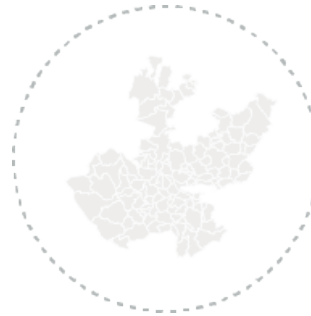
Por región de Jalisco