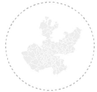
Por área metropolitana de Jalisco