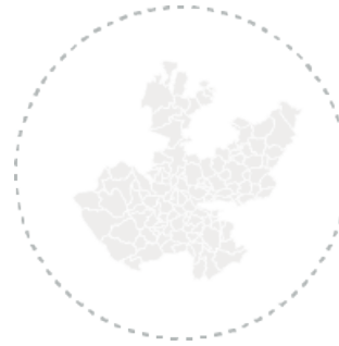
Por región de Jalisco