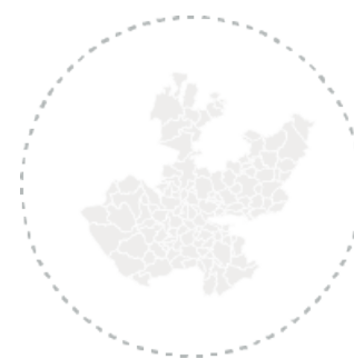
Por área metropolitana de Jalisco