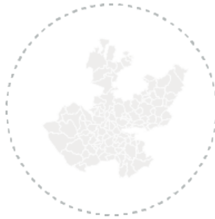
Por municipio de Jalisco